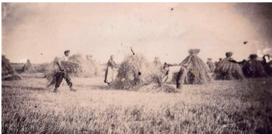
Vilja kogumine püstrõuku