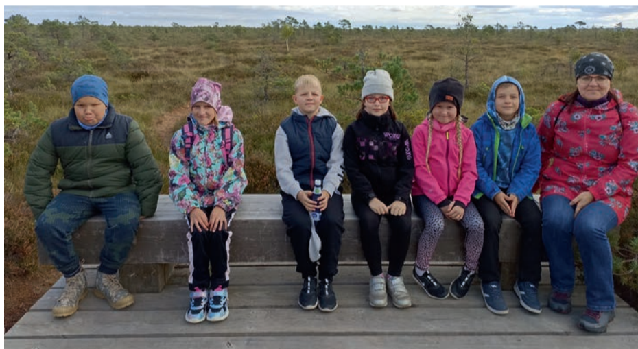
3. klass Tuhu matkarajal.