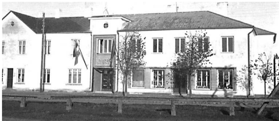
SAARDE pangamaja juurdeehitatud osa avati pidulikult 6. novembril 1938. aastal