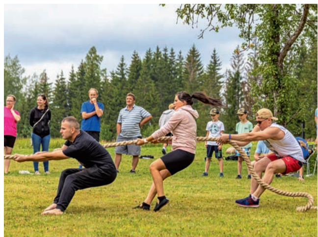
Külamängude võitja Tali võistkond köit tõmbamas.