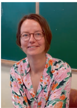
Otsustasin ka Tallinnast Jäärja külla kolida.

Vaba aega meeldib õues veeta, matkata, seenel käia või aias toimetada.