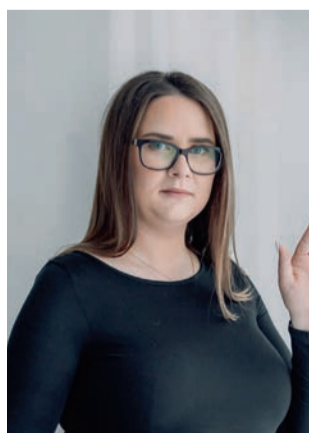
Oma erialavalikus olin kindel juba lapsena.

naasiumisse asun tööle abiõpetajana. Oma erialavalikus olin kindel juba lapsena ning õpetaja töö huvitas mind juba siis. Mõte Kilingi-Nõmme kooli tööle tulla oli juba mõned aastad tagasi, kuid siis jäi asi pooleli. Nüüd koolimajas ringi jalutades ja töökaaslastega tutvudes olen aru saanud, et olen tegelikult õiges kohas ning loodan, et ka õpilastega tutvumine läheb sama sujuvalt.