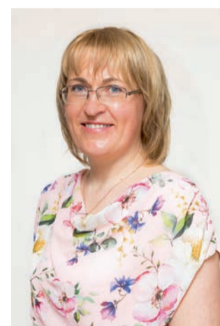
Olen tänulik, et saan õpetada oma kohaliku kogukonnakooli lapsi!

Saarde kogukonnas olen teinud vabatahtlikku tööd Saarde kirikus laste ja noortega kaksikümne aastat. Korraldanud koos meeskonnaga laste- ja noortepäevi, teinud lastetööd, jaganud peredele toidu- ja riideabi ning