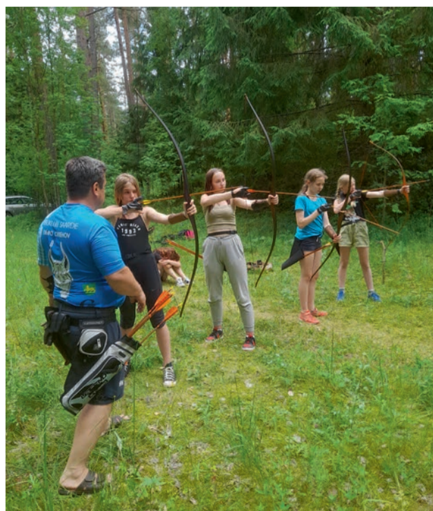
Fotod: Viire Talts ja Riina Teearu