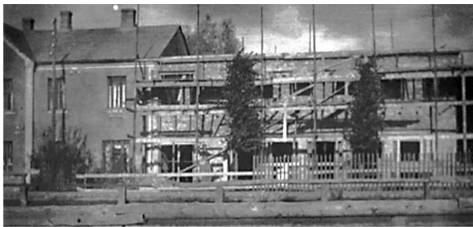
SAARDE panga ja LAENU-HOIÜHISUSE juurdeehitus 1936.–1938. aastal. Vaade Pärnu tänavalt